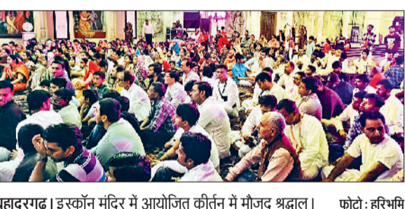
बहादुरगढ़। इस्कॉन मंदिर में आयोजित कीर्तन में मौजूद श्रद्धालु।