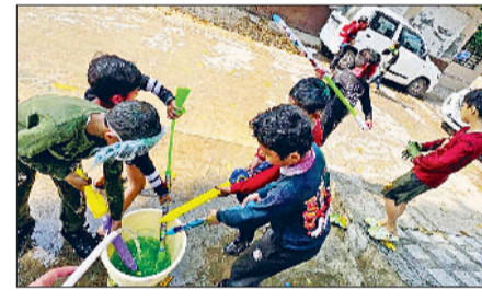
बहादुरगढ़। पिचकारी में पानी भरते बच्चे।