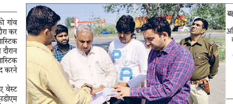
बहादुरगढ़। मौके पर अधिकारियों को निर्देश देते एसडीएम अभिनव सिवाच।

गांव नूना माजरा क्षेत्र में बनाए गए वेस्ट प्लास्टिक भंडारण स्थलों को लेकर एसडीएम अभिनव सिवाच ने ग्राम सरपंच की मौजूदगी में संबंधित व्यक्तियों को पंचायती राज अधिनियम के तहत कड़ी हिदायत जारी की। उन्होंने सख्त निर्देश देते हुए कहा कि निर्धारित