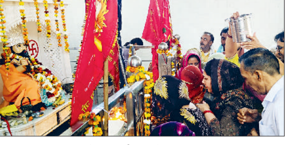
बहादुरगढ़। बाबा हरिदास के समक्ष शीश नवाते श्रद्धालु।