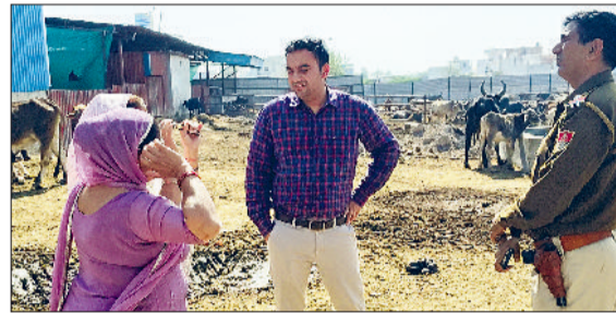
बहादुरगढ़। मौके पर एसडीएम को पूरे मामले की जानकारी देती महिलाएं।