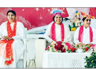
बहादुरगढ़। कार्यक्रम के दौरान मंचासीन ब्रह्माकुमारियां।

ने सभी को होली का आध्यात्मिक रहस्य बताया। उनके अनुसार होली अर्थात जो बीता उसे भूल कर एक नई उमंग उत्साह से जीना है। बहुत ही शुद्ध और पवित्र तरीके से इन त्योहारों को मनाया है। सेक्टर 13