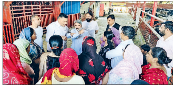
बहादुरगढ़। नदीशाला के संचालकों के समक्ष विरोध जताती महिलाएं।