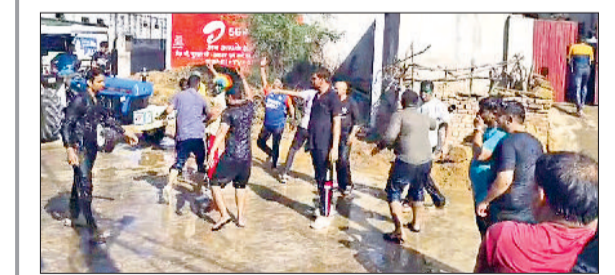
झज्जर। दुल्हेड़ी पर्व पर मस्ती करते हुए युवा।

झज्जर। बुधवार को दुल्हेड़ी पर्व के चलते लोगों ने जमकर गुलाल उड़ाया। बच्चों-बड़े यहां तक की बुजुर्गों ने भी दुल्हेड़ी पर्व का खूब आनंद उठाया। अलसुबह ही बच्चे घरों से निकल कर हाथों में रंग व पिचकारी लिए हुए लोगों पर पानी व रंग उडेलते दिखाई दिए। दिव्यरंग रंग-बिरंगे रंगों में सजे युवाओं के चेहरे मस्ती करते नजर आए। व्यक्तियों ने अपने घर के बुजुर्गों के पैरों में गुलाल लगाकर उनका आशीर्वाद लिया। घर की महिलाओं द्वारा स्वादिष्ट व्यंजन बनाए गए। इसके अलावा कई जगहों पर देवर-आमी के बीच पानी व कोरडों से खेली जाने वाली होली भी खेली गई। जिसमें महिलाएं पानी बरसाने वालों पर कपड़ों से बनाव गए कोरडे और उड़े बरसाती नजर आरंभ। पूरे दिन गर्मी का माहौल रहा जहां पानी से होली खेलने में युवाओं ने आनंद उठाया।