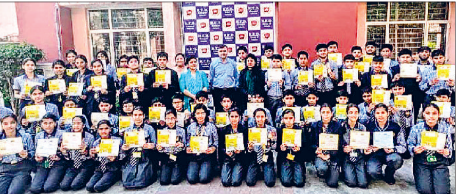
झज्जर। शिक्षकों के साथ उपस्थित ओलंपियाड के उतीर्ण विद्यार्थी।