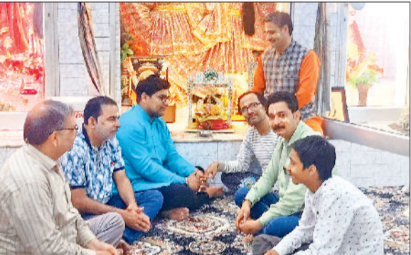
झज्जर। कार्यक्रम के दौरान मंदिर परिसर में उपस्थित श्रद्धालु।