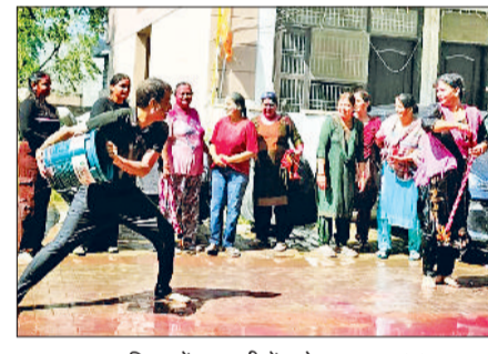
बहादुरगढ़। महिलाओं पर पानी फेंकते पुरुष।