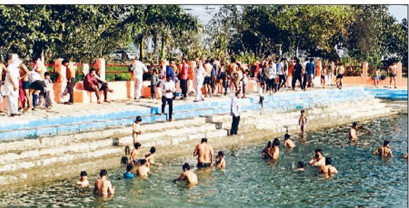
बहादुरगढ़। टांडाहेड़ी के पवित्र तालाब में स्नान करते श्रद्धालु।