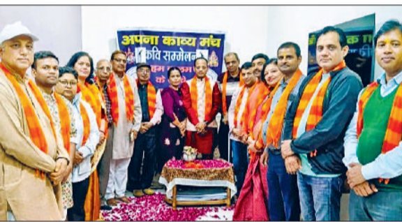
बहादुरगढ़। काव्योत्सव में भाग लेने वाले क्षेत्रीय रचनाकार।

रंगों का त्योहार होली बहादुरगढ़ में पूरे हर्षोल्लास से मनाया गया। बुधवार को सारा दिन होली की मस्ती में डूबे लोगों ने जमकर धमाल मचाया। कॉलोनी, गली व बाजारों में सुबह से लेकर दोपहर तक खूब गुलाल उड़ा। वहीं क्लीन एंड ग्रीन एसोसिएशन द्वारा मिट्टी से होली खेली गई। दुल्हेड़ी पर लोगों ने एक दूसरे को बधाई देकर अबीर गुलाल व रंगों से सराबोर किया। त्योहार की मस्ती में डूबे लोगों की हंसी, ठिठोली से वातावरण रंगीन बन गया। दिन निकलते ही बच्चे घरों से निकल पड़े और एक दूसरे पर पिचकारियों की बौहार शुरू कर दी। म्यूजिक सिस्टम की खनक पर युवा वर्ग थिरकता नजर आया। शहर से लेकर गांवों में लोगों ने होली के त्योहार का जमकर आनंद उठाया। परंपरा के अनुसार गांवों में देवरों ने भांधियों पर पानी फेंका तो उन्होंने खूब कोड़े मारे। वहीं क्लीन एंड ग्रीन ट्रस्ट के सदस्यों ने मिट्टी से होली खेली। धरती व पर्यावरण से प्रेम का संदेश भी दिया। कई स्थानों पर होली पर्व के समारोहों का भी आयोजन किया गया।