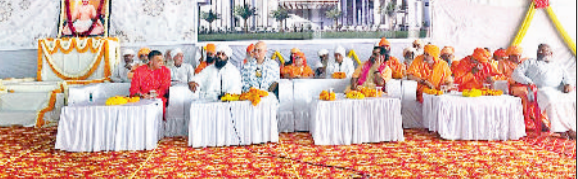
झज्जर। फाग उत्सव के दौरान मंच पर उपस्थित संत-महात्मा।